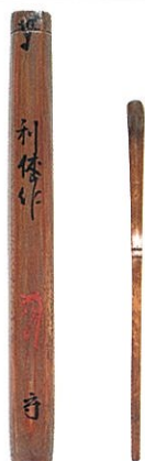
千利休茶杓 追筒 桃山時代(16世紀)

絢爛豪華な「黄金の茶室」(復元)と桃山・江戸の茶の湯に関わる美術品、そして現代に受け継がれる日本美術の粋をお楽しみください。