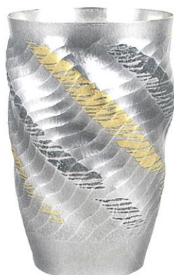
大角幸枝 南鍍花器 海風 1997年