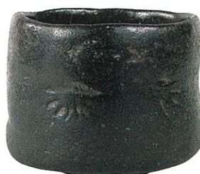
長次郎 黒染菊押茶碗 桃山時代(16世紀)