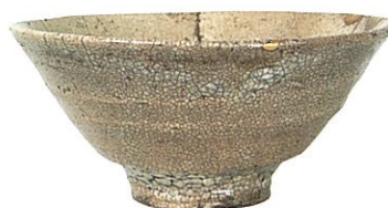
井戸茶碗 銘 常盤 李朝時代(16世紀)