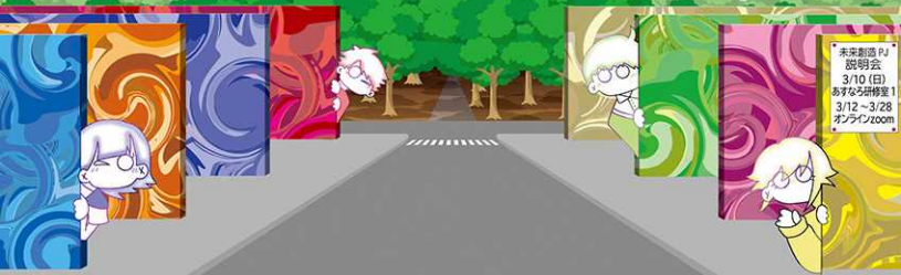
【4人のイラスト制作】 未来創造PJメンバー Amane (中)

未来創造PJ 説明会 3/10(日) あすなる研修室1 3/12~3/28 オンラインzoom